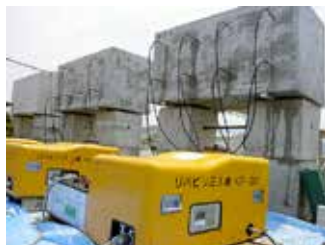
大型供試体によるASR抑制効果検証実験