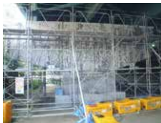
橋脚(はり部)のASR補修事例