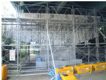
橋脚(はり部)のASR補修事例