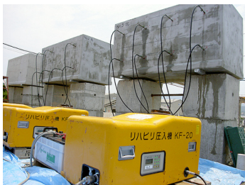
大型供試体によるASR抑制効果検証実験