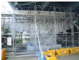
橋脚(はり部)のASR補修事例