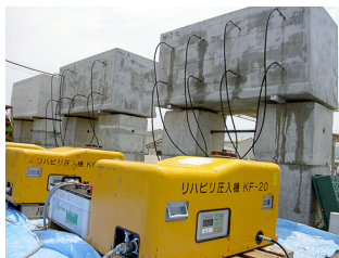
大型供試体によるASR抑制効果検証実験